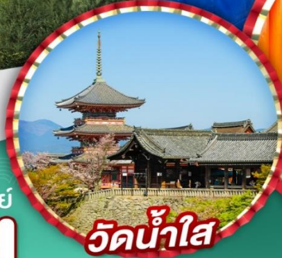
วัดน้ำใส