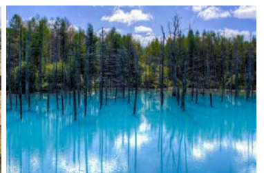
Bie Blue Pond

วันแรก กรุงเทพฯ – สนามบินชิโตเซ่ (เกาะฮอกไกโด)